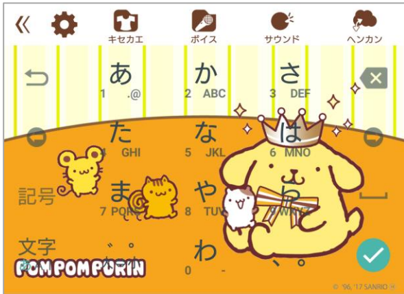
ポムポムプリン 20周年