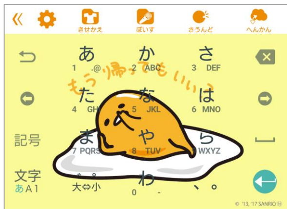
ぐでたま もう帰ってもいい？