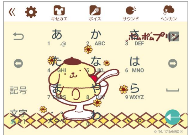
ポムポムプリン グラス

©1996, 2017 SANRIO CO., LTD. TOKYO, JAPAN®